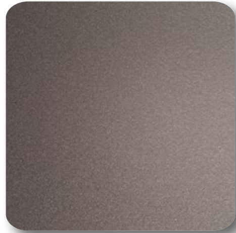
Naturel Serawak 49AG Matte Attraktion