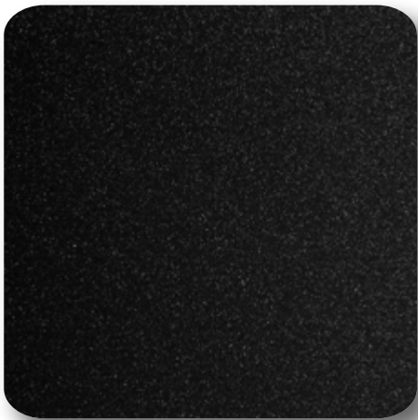
Hairexcel Altaïr 69F4 Design for life