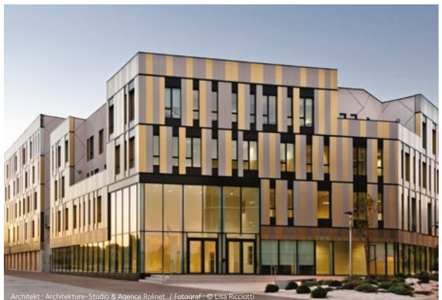
Architekt : Architecture-Studio & Agence Rolinet