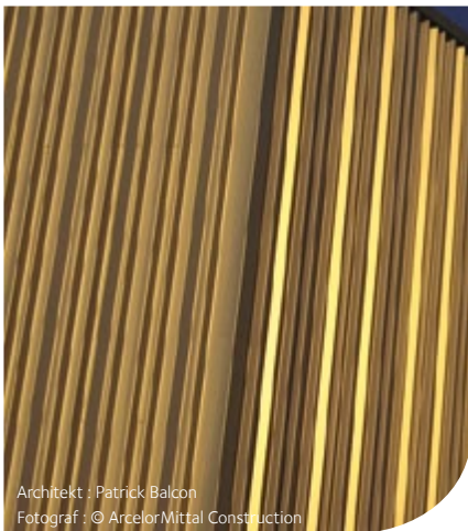
Architekt : Patrick Balcon Fotograf : © ArcelorMittal Construction

Gold hat einen ganz besonderen Charakter. Schon seit Urzeiten verwenden wir das Edelmetall, um uns selbst und die Dinge, die uns wichtig sind, zu verschönern.