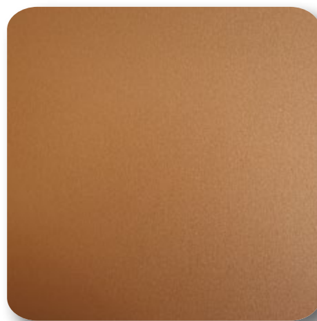
Hairexcel Topazio Design fürs Leben