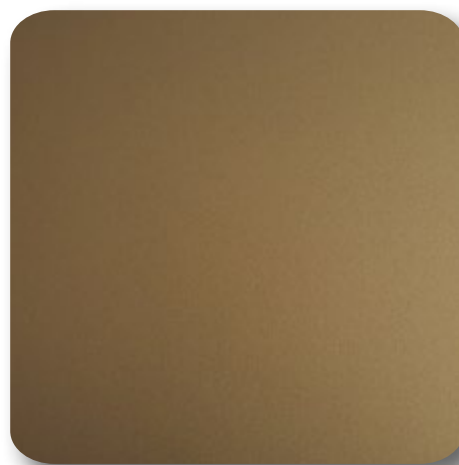
Authentic Aeris Sanfter Glanz