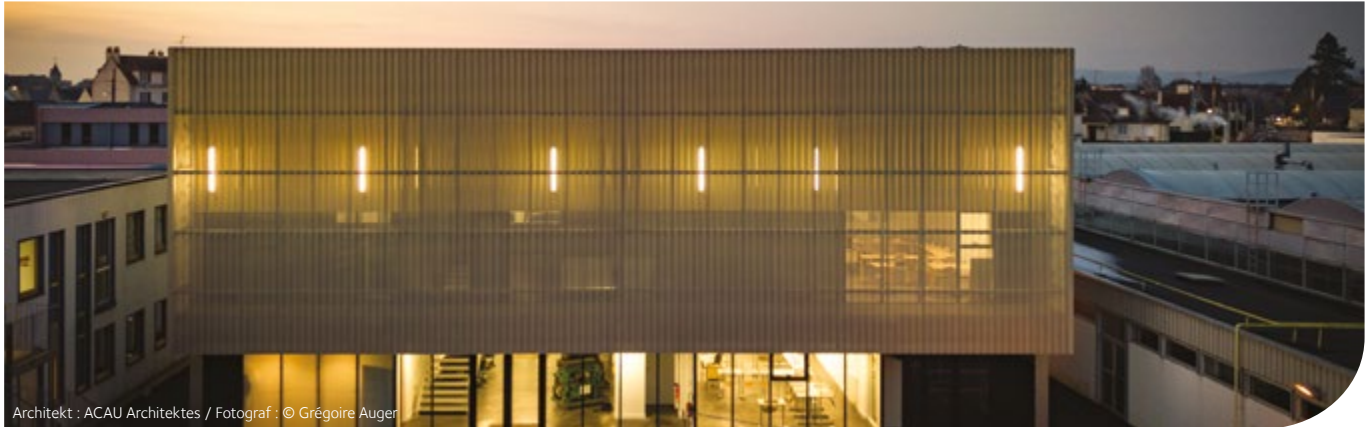
Architekt : ACAU Architectes