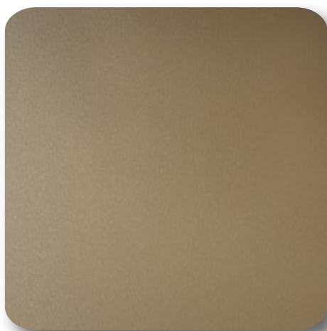
Hairexcel Citrin Design fürs Leben